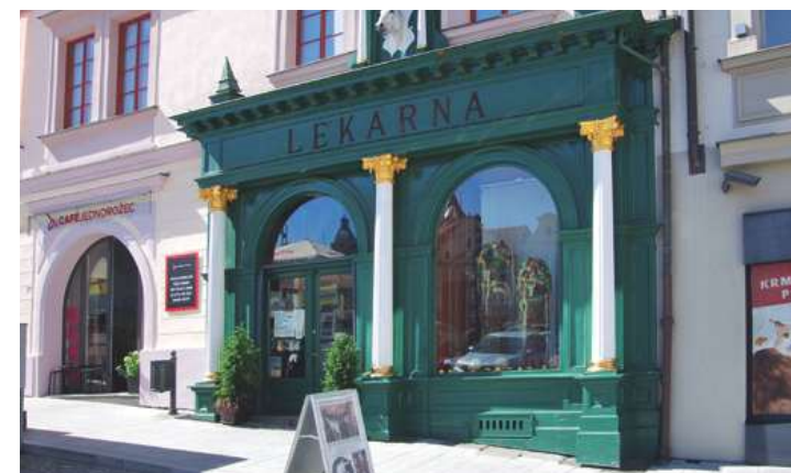
Vzácná barokní lékárna U Bílého jednorozce představuje další turistické lákadlo na centrálním náměstí Míru

životě. V parku zámku ve Veltrusích se v červenci roku 1873 potkal se spisovatelkou Sofií Podlipskou, sestrou Karolíny Světlé. Znal její knihy, obdivoval ji, o rok později se s ní blíže seznámil v Umělecké