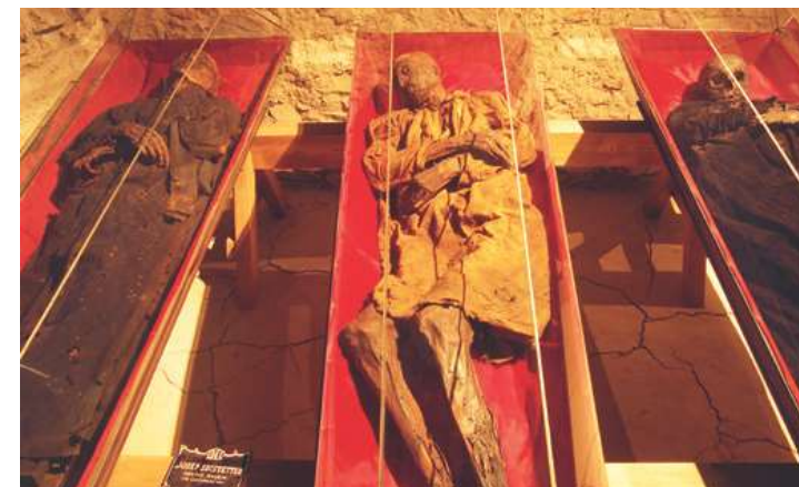
V podzemí kostela Neposkvrněného početí Panny Marie a sv. Ignáce se nacházejí katakomby s mumiemi

V roce 1901 byl Vrchlický spolu s Antonínem Dvořákem povýšen do šlechtického stavu, stal se členem Panské sněmovny Říšské rady ve Vídni. Vedle toho byl členem mnoha prestižních institucí, hlavně se ale stal úspěšným autorem. Vydal přes 80 básnických sbírek, napsal 50 divadelních her včetně legendární Noci na Karlštejně , přispívána jsou mu i některá erotická či pornografická díla jako Rytíř Smil , byl také úspěšným překladatelem. Složitější to měl v osobním