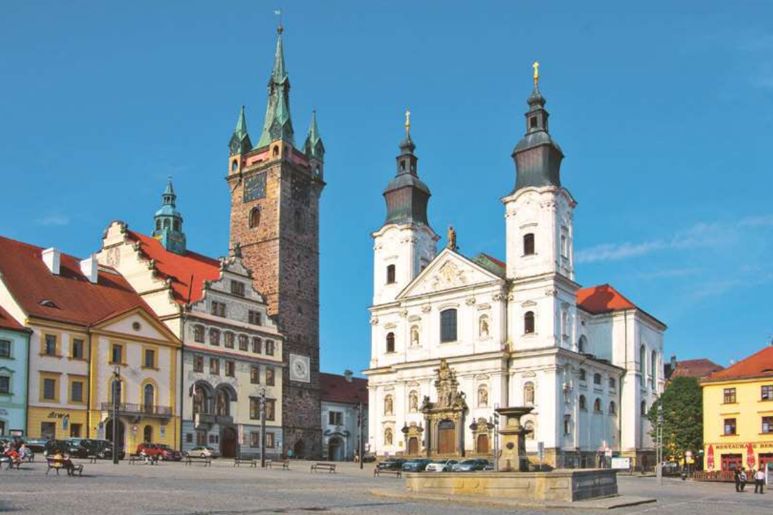
Sněhově bílý jezuitský chrám společně se sousední Černou věží patří mezi symboly města Klatovy