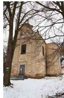
Kostel sv. Petra a Pavla je v nedobřem stavu, o jeho obnovu usiluje spolek Oživování kostela sv. Petra a Pavla na Zbirožsku

Od jablecké hájovny dále pokračujeme po modré turistické značené trase (TZT) a procházíme