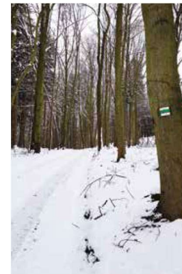
Cesta je dobře značená, není možné zabloudit

Z Matčiny hory klesáme k Sýkorovu mlýnu. Než tam ale dojdeme, spatříme po naší levici studánku, která se stala J. V. Sládkovi inspirací k již zmíněné básni Lesní studánka. Nedaleko pramene je umístěna deska z roku 2012, která spojení tohoto místa s básníkem připomíná. A pokud byste si nedokázali na celou báseň vzpomenout z paměti, pak si ji můžete osvěžit za pomoci textu na přístřeší studánky.