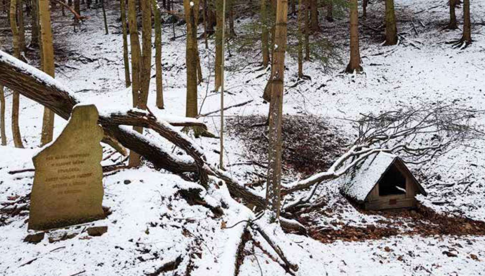
Sládkova studánka se nachází v lese přezdívaném V Království