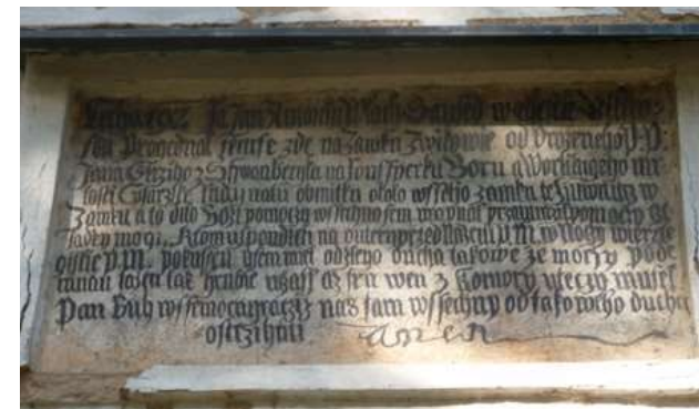
Deska u vchodu do hradu informuje o setkání zednického mistra se zvíkovským raráškem v roce 1597