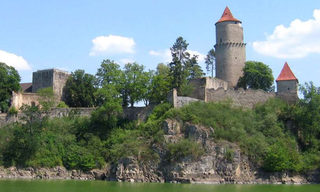
Majestátní hrad Zvíkov ve svých zdech ukrývá mnoho nerozluštěných záhad